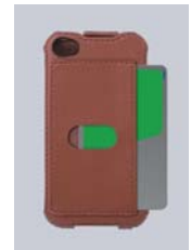
ICカードポケット付き