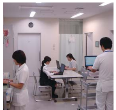
病院のICT化を積極的に推進されています

電子カルテの導入に踏み切ったので、それに合わせてネットワークを構築する必要があり、無線LANの設置を決めました。病棟で端末に情報を入力したり、見たりできるようにするには無線通信は不可避と判断したわけです。配線類で乱雑になりがちで、メンテナンスをすっきりさせたいという気持ちもありました。