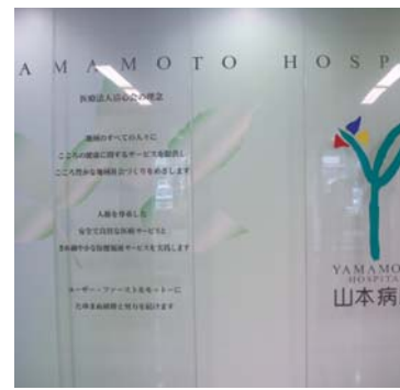
山本病院様の理念「ユーザー・ファースト」

「地域のすべての人々にこころの健康に関するサービスを提供し、こころ豊かな地域社会づくりをめざします」「人権を尊重した安全で良質な医療福祉サービスと、きめ細やかな保険福祉サービスを実践します」「ユーザー・ファーストをモットーに、たゆまぬ研鑽と努力を続けます」の3つを理念に医療サービスを提供しています。