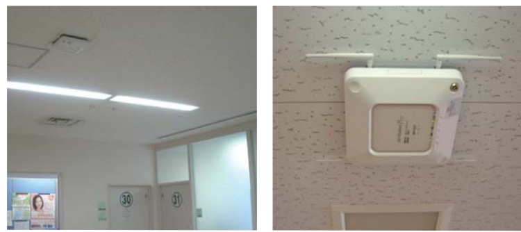
各階フロアの天井にアクセスポイントを合計40台設置。工事もしやすいようスムーズに設置作業が行われました

のアクセスポイントを設置し、管理ソフトウェアを合わせて導入して通信環境を整えるという提案でした。バッファローさんの機種を選んだのはコムネットシステムさんが「安全性が高くコストも有利。公共施設でも実績があり、信頼性が高い」と評価していたからです。工事がしやすいということもおっしゃっていました。