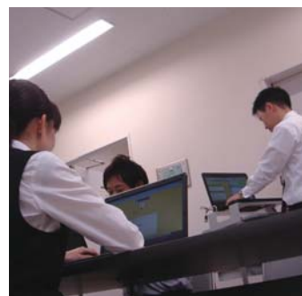
情報をスタッフが共有することで医療ミスの防止をめざされています

精神科は他の診療科目と比べ、患者さん一人当たりの診察時間が長くなる傾向があります。その分、医師の負担が重くなるのですが、その負担やストレスが少しでも軽くなることで医療の質が向上していくことを期待しています。看護師の場合も同じです。また、情報をスタッフが共有することで医療ミスの防止につながることも期待しています。