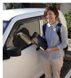
訪問看護時にも無線LAN/パソコンによる外部からの院内ネットワークへの接続を検討中です

所在地:〒581-0025 八尾市天王寺屋6-59 電話:072-949-5181 Web: http://www.yamamoto-hp.or.jp/