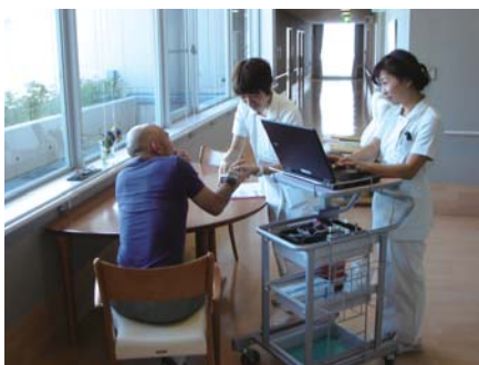
どこでもネットワークに接続できるので、どこにきめ細やかなケアが可能になりました

いますが、評判は上々です。医師の中には常にパソコンを持ち歩いている方もおられ、情報を見たり入力したりするのにいちいち診察室やナースステーションに戻らずに済むのがありがたいと言ってくださる方もいます。とにかく高評価をいただいています。