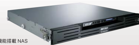
テラステーション 管理者・RAID機能搭載 NAS 1Uラックマウントタイプ