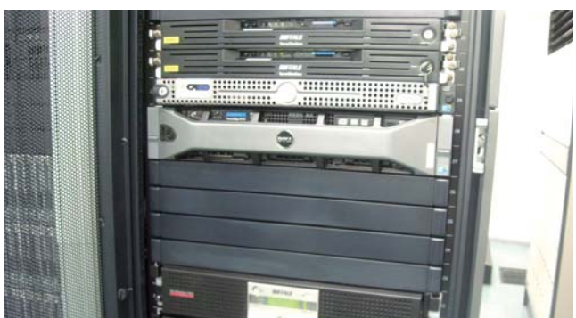
弊社のテラステーションはラックマウント初代モデルから継続してご利用いただいております

データセンターの広さには限界があり、NASもできるだけ省スペースにしたいと思っていましたから、薄くて、縦に積み上げているラックマウント対応型のほうがふさわしいと考えていました。このタイプのものがほしいということとをバッファローさんに伝えたこともあり、ですから、発売されたときはすぐさま導入させていただきました。