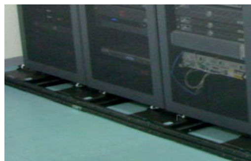
免震システムをISO-Baseを採用したラックにお客様の大切なデータを保管されています

もし火災になった場合、ラックに付けた高感度センサーが検知し、10秒以内にガス消火システムが働くようになっていきます。また停電になっても非常用のバッテリー装置を設置していますからデータが失われることはありません。またセキュリティ対策では静脈認証システムによる入室管理を行っており、日本有数の安全性を備えたデータセンターと自負しています。実際、行