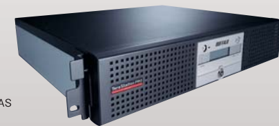
テラステーション 管理者・RAID機能搭載 NAS 2Uラックマウントタイプ