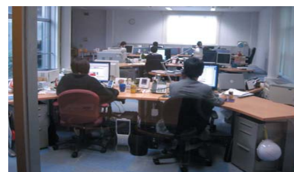
プロバイダーサービス、コンテンツ制作サービス、ネットワーク構築サービス、IT教育サービスと幅広い事業を展開されています

インターネット接続サービスやドメインの管理・運用などを行う「プロバイダーサービス」、ホームページの企画・制作などの「コンテンツ制作サービス」、そ