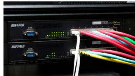
レイヤ2 PoEスイッチ BS-POE-2008MR

PoE機能への対応も重要でした。電源をネットワークケーブル経由で供給できるので、コンセントを別に用意する必要がありません。壁面をきれいに使うことができます。ちなみに、PoE機能対応のレイヤ2スイッチもやはりバッファロー製品です(採用製品 BS-POE-2008MR)。