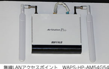
無線LANアクセスポイント WAPS-HP-AM54G54