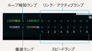
ループ検知ランプ