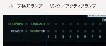
ループ検知ランプ